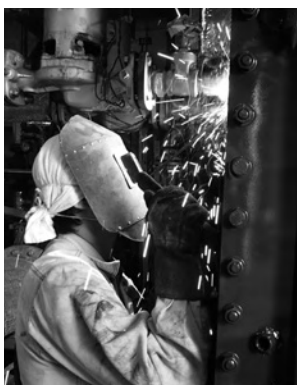
現場でのボイラー修理は被覆アーケ 溶接の技術が必要になる