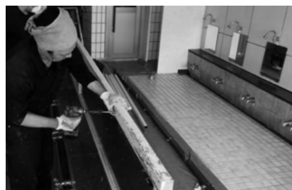
配管工事・シャワーの取付・ポンプ修理等 浴場に関する設備に幅広く対応

そして地域の銭湯未経験者に向けて、浴場設備会社ならではの独自視点で銭湯の良さを伝えたい。そのひとつとして、当社のHPでお客様の紹介や製品のこだわりなどを発信しています。昔からの常連さんが憩いの場として集う現在まで築いてきた銭湯文化は素敵ですが、銭湯を次世代に伝えるには、若者が銭湯へ気後れな