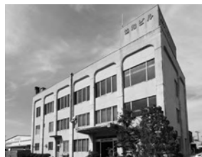
協和工業株式会社・社屋の風景

など公衆浴場の設備を行い、現在に至っています。 当社の主力商品は、浴場施設用のボイラー、ろ過機、熱交換器などの浴場設備機器であり、それらは全て社内で作上げ、社員が取り付けに行くという一貫工程で行っています。浴場という性質上、メーカーとして商品の耐性が重視されますので、腐食や摩耗した時のメンテナンスと修理も対応しています。 これほどまでに浴場施設に特化したのは、二代目が設立まもなくして銭湯用に外付けボイラーを製造したことが始まりです。他県にあったものを参考にして作った石川県内初のボイラーは注目を集め、瞬く間に地域の銭湯へ広がったそうです。 現在、当社が製作しているボイラーは「温水缶ボイラー」といって、圧力容器ではなく無圧温水缶です。取扱者の資格免許は不要で、また、燃焼装置によってA重油・廃油・おが屑・木屑・木質ペレットなど、様々な燃料に対応しており高効率であるところが、需要が生まれた要因でもあります。