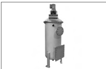
リニューアルした攪拌装置式ろ過機