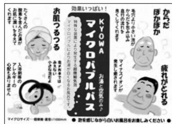
独自開発の協和式マイクロバブルバス。構造の簡略化を図り、メンテナンス部を極力減らしたオリジナル製品

く行けるよう、今の時代に合う銭湯も考えて提案して共に作ってきたい。そのためには若い皆さんの感性が必要なのです。