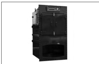
主力製品の温水缶ボイラー