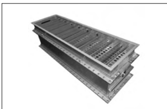
新製品 ステンレス製排水熱交換器

など公衆浴場の設備を行い、現在に至っています。 当社の主力商品は、浴場施設用のボイラー、ろ過機、熱交換器などの浴場設備機器であり、それらは全て社内で作上げ、社員が取り付けに行くという一貫工程で行っています。浴場という性質上、メーカーとして商品の耐性が重視されますので、腐食や摩耗した時のメンテナンスと修理も対応しています。 これほどまでに浴場施設に特化したのは、二代目が設立まもなくして銭湯用に外付けボイラーを製造したことが始まりです。他県にあったものを参考にして作った石川県内初のボイラーは注目を集め、瞬く間に地域の銭湯へ広がったそうです。 現在、当社が製作しているボイラーは「温水缶ボイラー」といって、圧力容器ではなく無圧温水缶です。取扱者の資格免許は不要で、また、燃焼装置によってA重油・廃油・おが屑・木屑・木質ペレットなど、様々な燃料に対応しており高効率であるところが、需要が生まれた要因でもあります。