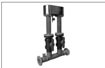
特許取得 ノズル詰まり防止ユニット